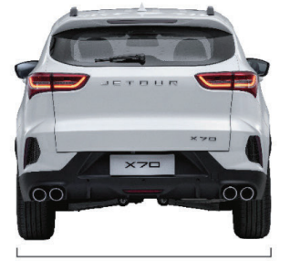
الارتفاع الكلي: 1720 مم العرض الكلي: 1900 مم عرض المسار : 15 (أمامي/خلفي) 1563 / 1577 مم