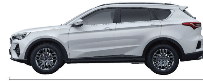
الطول الكلي: 4743 مم قاعدة العجلات: 2720 مم