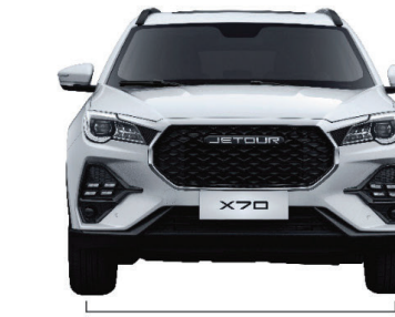
عرض المسار: 1900 مم