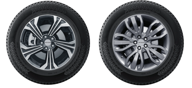
جنوط مقاس 18